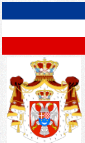
National symbols, Mozaik proslosti, Bigz 2010

Bože pravde, ti što spasi, od propasti do sad nas! Čuj i odsad naše glase i od sad nam budi spas!